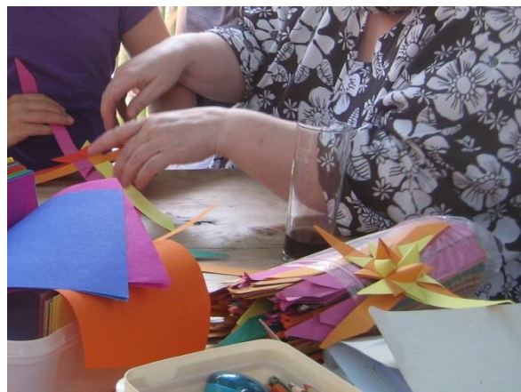
Hier wird erklärt, wie man Fröbelsterne faltet.